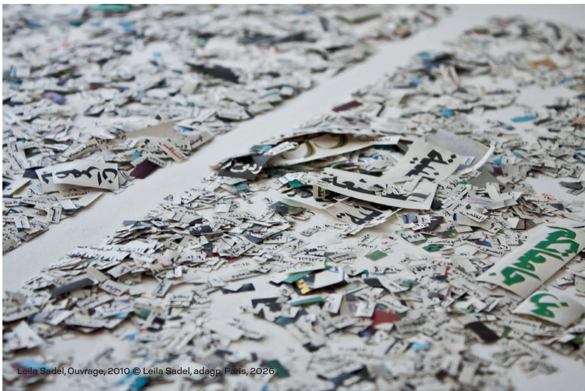
Leila Sadel, Ouvrage , 2010 © Leila Sadel, adagp, Paris, 2026

Elle insuffle pour chaque nouveau projet une direction et un sens spécifique qui se construit par une imprégnation des histoires et des témoignages de la mémoire des territoires traversés.