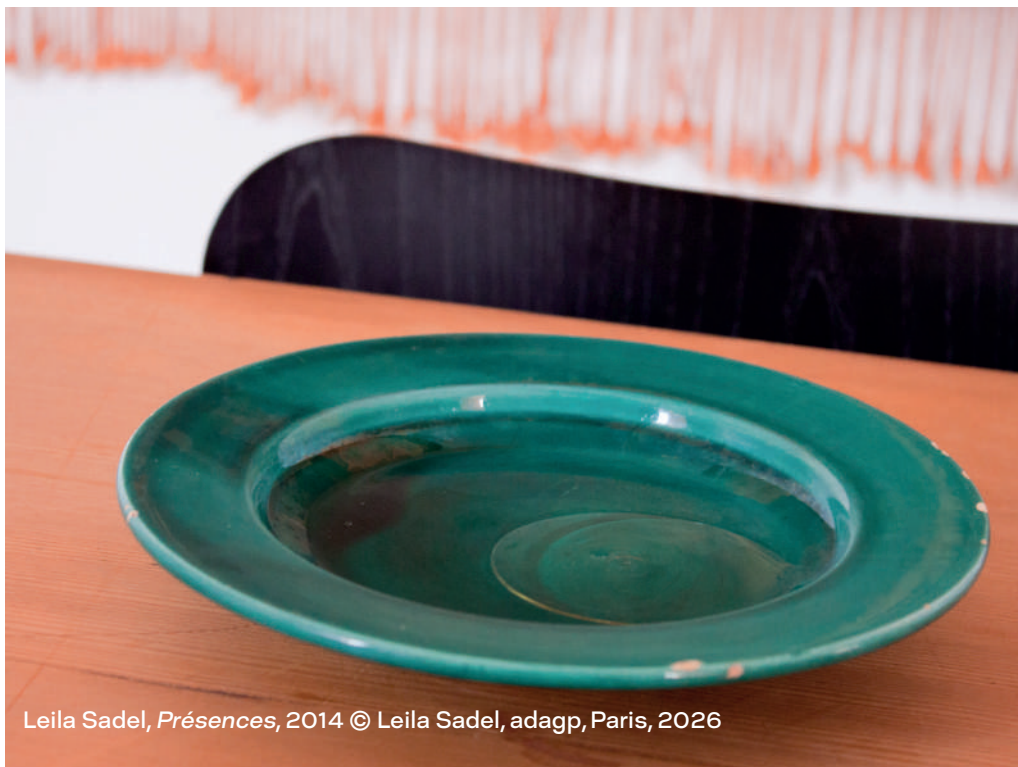
Leila Sadel, Présences , 2014 © Leila Sadel, adagp, Paris, 2026

Elle recense les objets utilisés et les met en scène dans de nouvelles configurations, créant ainsi des rituels réinventés, déconnectés de leur sens d'origine. Par ce processus, elle cherche à opérer une mise en abyme et à « crypter » à nouveau ces usages culturels.